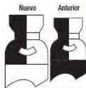
Aire grado MED MedAireSin