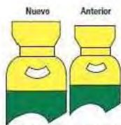
Dióxido de Azufre (SO 2 )