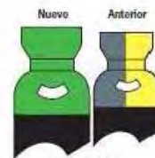
Ferromaxx 7 Inomaxx 2