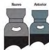
Dióxido de Carbono (CO 2 )