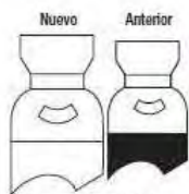
Oxígeno grado MED