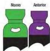
Hexafluoruro de Azufre (SF 6 )