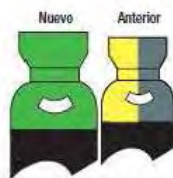
Protar 5/8/12/15/18/20/ INOX/MP