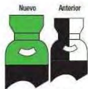
Aire Sint, Aire