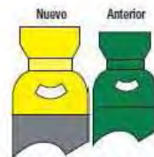
Amoniaco (NH 3 )