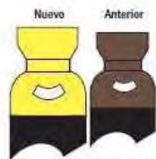
Cloruro de Hidrógeno (HCl)