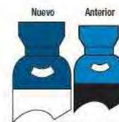
Protóxido de Nitrógeno (N 2 O)